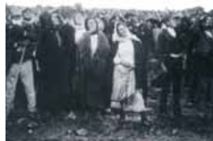
攝於1917年10月13日，最後一次顯現。在太陽開始「跳舞」時。