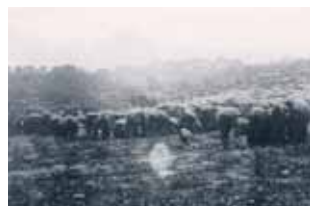
攝於1917年最後一次顯現。就在太陽開始「跳舞」前，群眾聚集觀看。